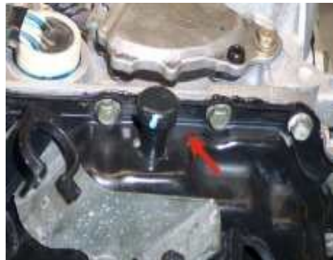
Einfüller Rover 75

* Alle Angaben ohne Gewähr. Füllmengen, Kontrollverfahren und Spezifikationen stammen aus unserer täglichen Praxis und müssen nicht mit den Angaben der Hersteller übereinstimmen. Insbesondere bei der Empfehlungen der Ölsorte übernehmen wir keinerlei Haftung, auch dann nicht, wenn sich versehentlich Fehler eingeschlichen haben sollten. Im Zweifel und zu Ihrer Sicherheit sollten Sie die Angaben beim Hersteller überprüfen lassen.