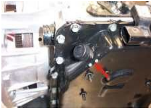
Einfüller 09A Golf 09B Šaran