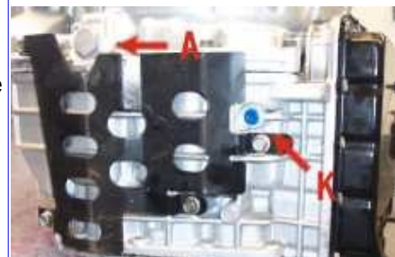
Bei Golf und A3 A= Ablassschraube K= Kontrollschraube Imbuss 5 mm