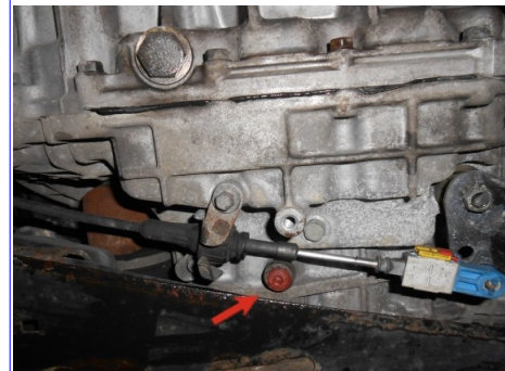
Kontrollschraube bei Ford Mondeo

Differential wird vom Getriebeöl mit geschmiert