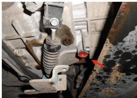
Kontrollschraube bei Jaguar X-Type